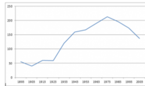
De ledentallen van de kerk te Kolhorn.

Op 10 december 2006 zijn de Hervormde Gemeente te Barsingerhorn-Winkel en de Gereformeerde kerk te Kolhorn – na eerder een federatieve overeenkomst te zijn aangegaan – verenigd tot de Protestantse Gemeente te Winkel e.o.