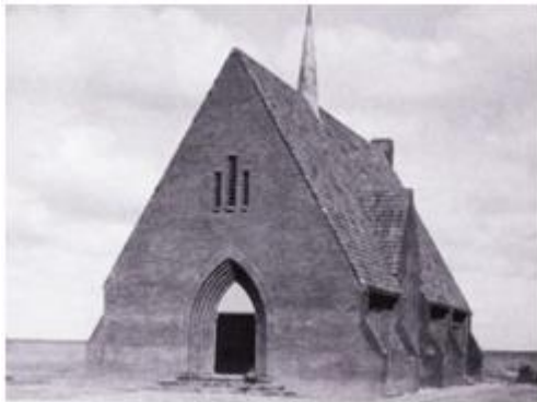
Het gereformeerde 'recreatiegebouw' te Slootdorp.

Maar het was vooral een gereformeerde kerk... Het gebouwtje deed dienst van 21 juli 1932 tot 2 april 1938, toen daar de laatste dienst gehouden werd en de nieuwe, grotere kerk in gebruik genomen werd.