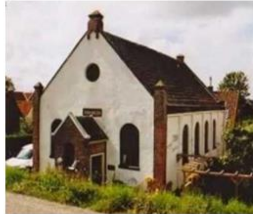
De gereformeerde kerk te Kolhorn.

achter tegen de kerk aan bouwen, waarvoor fl. 490 neergeteld moest worden. Gelukkig was er weer een gemeentelid die fl. 400 te leen had tegen een rente van 4%, met een aflossing van fl. 25 per jaar. Ook de brandverzekering ging omhoog; het verzekerde bedrag steeg van fl. 3.200 naar fl. 6.000.