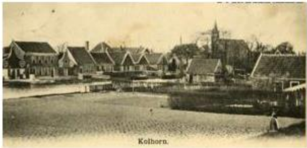
Zicht op Kolhorn.

Als een predikant in het kerkje aan de Westfriesedijk voorging nam men de gelegenheid te baat de kinderen te laten dopen, werd door belijdeniscatechisanten geloofsbelijdenis afgelegd en het avondmaal gevierd. Veel moeite kostte het om de preekvoorziening rond te krijgen. Nog steeds moesten door de ouderlingen vaak leesdiensten gehouden worden. Ook werd door hen catechisatie gegeven, zondagschool gehouden, huisbezoek gedaan. Dat kwam neer op weinig schouders en moest met weinig middelen gedaan worden.