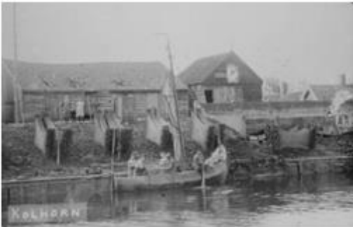
zicht op Kolhorn

De financiën bleven een moeilijk punt. Bijna op elke maandelijkse kerkenraadsvergadering werden die besproken. Maar ook de verspreid wonende leden, van elders aangetrokken door het werk in de nieuwe polder, gaven veel reden tot zorg. In hun eigen woonplaats waren ze veelal trouwe kerkbezoekers, maar in de verstrooiing liet velen het afweten. Dat leverde voor de kerk van Kolhorn schade op, door het verlies van kerkelijke bijdragen en collecteopbrengsten. Vandaar dat geregeld stemmen opgingen om als kerk aansluiting te zoeken bij de kerk van Dirkshorn. De kerkenraad koos daar echter toch niet voor.